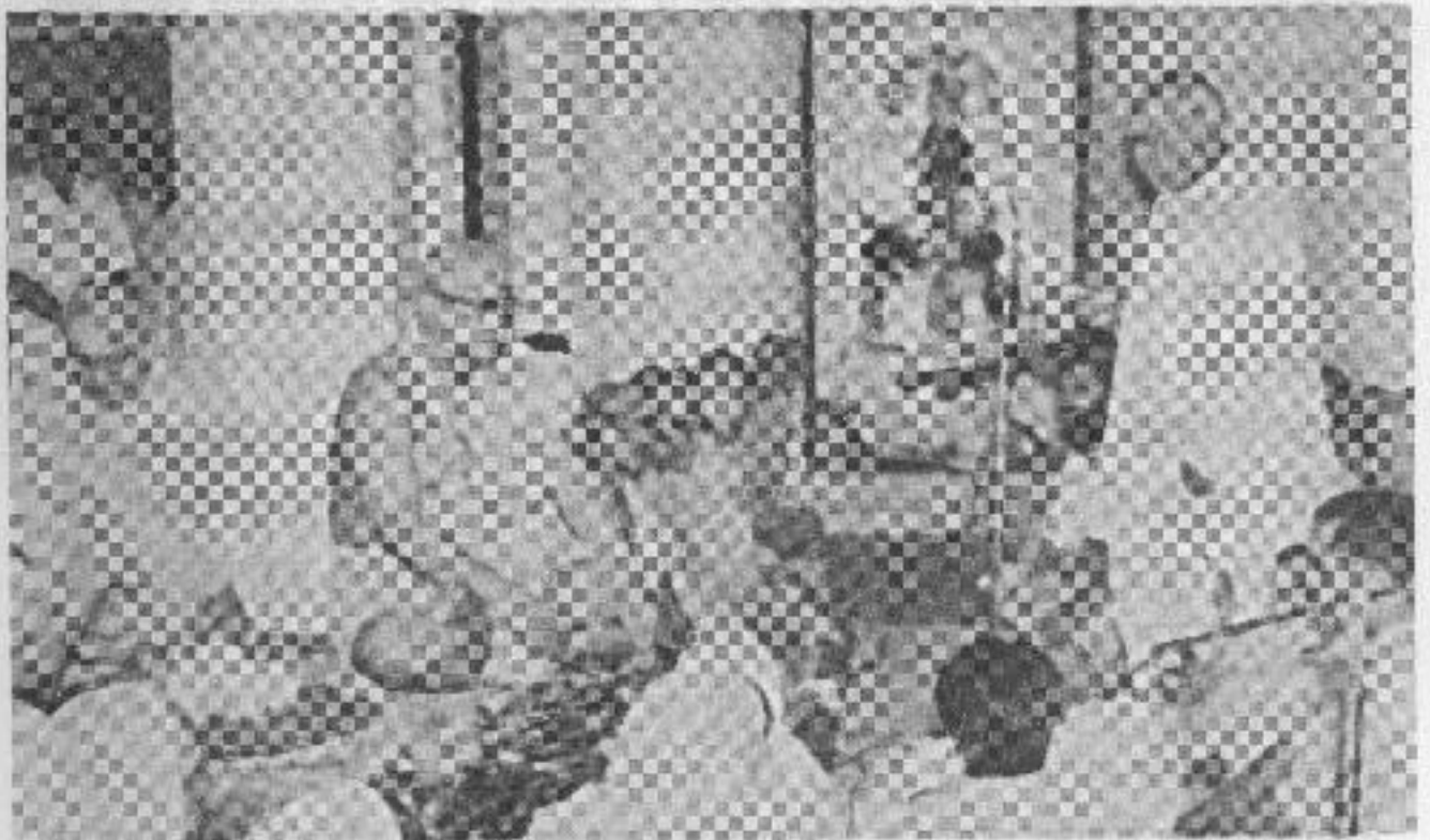
श्रीकृष्ण जन्मभूमि मथुरामें