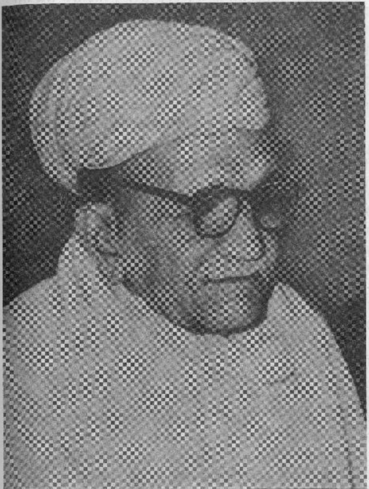
गीताप्रेस के संस्थापक - संत प्रवर सेठजी श्रीजयदयालजी गोयन्का