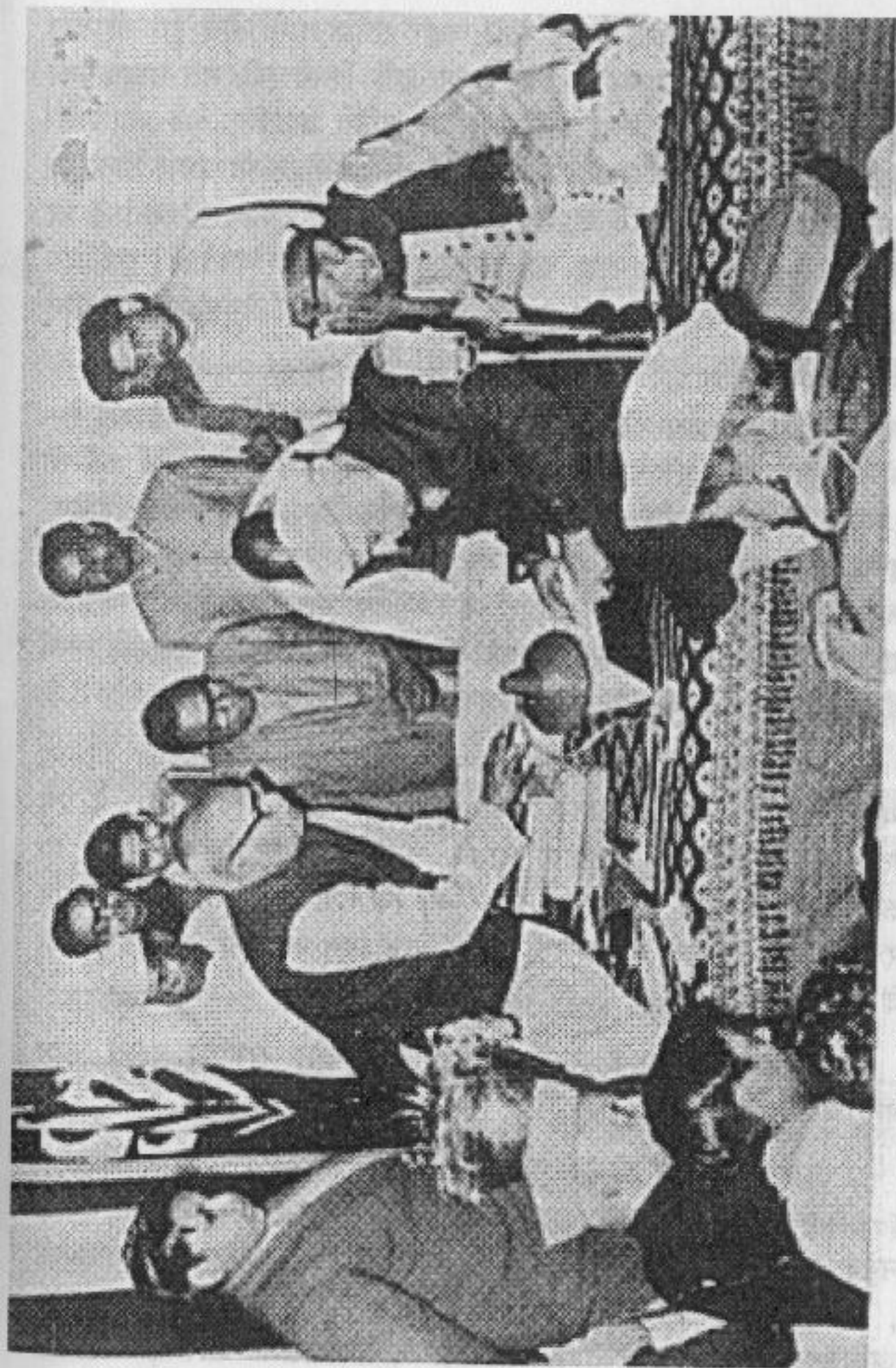
प्रधानमंत्री श्री जवाहरलाल नेहरू को गीताप्रेस के प्रकाशनों का उपहार प्रदान करते हुए