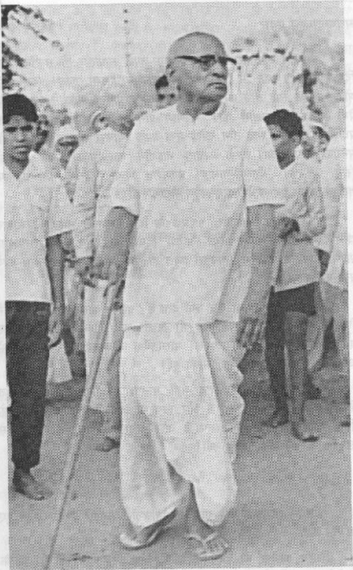
नगर संकीर्तन का नेतृत्व करते हुए