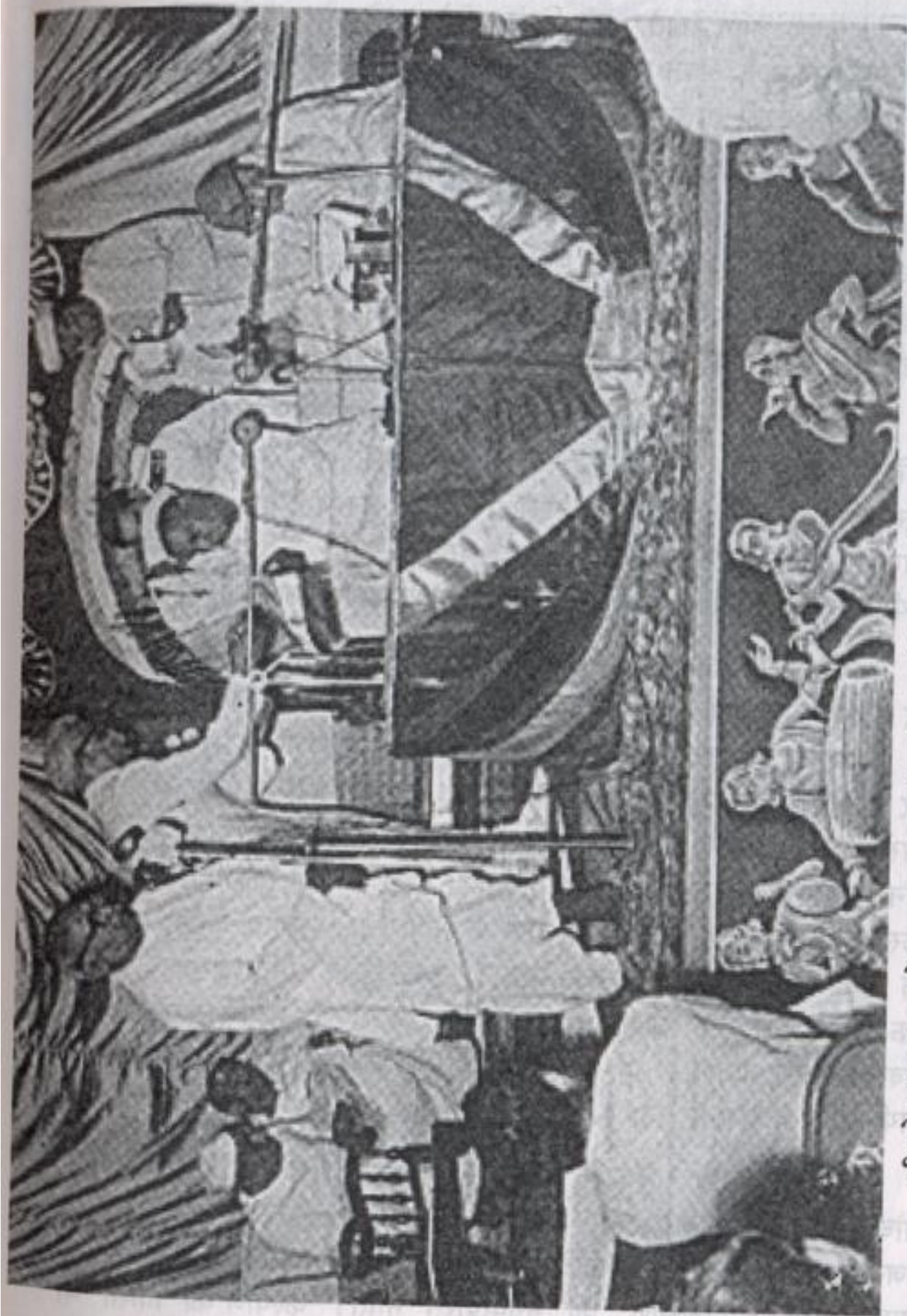
गीताप्रेस मुख्यद्वार के उद्घाटन समारोह में राष्ट्रपति डा. राजेन्द्रप्रसाद का स्वागत भाषण करते हुए